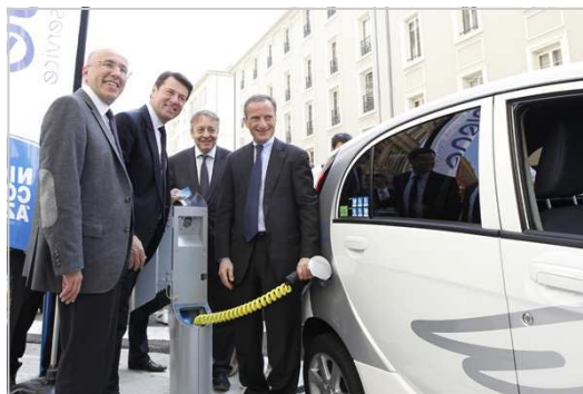
De gauche à droite : Eric Ciotti (Président du Conseil Général des Alpes Maritimes), Christian Estrosi (Député-Maire de Nice, Président de Nice Côte d'Azur), Antoine Frerot (Président de Veolia Environnement) et Henri Proglio (Président d'EDF).

Le second objectif poursuivi par la collectivité est la réduction de la pollution urbaine qui pose un réel problème de santé publique. « 1 km en Auto Bleue émet seulement 8 grammes de CO2. Pour un véhicule thermique, il faut compter 120 à 128 grammes, soit 20 fois plus qu'une voiture électrique » a commenté lors de son discours Christian Estrosi, Député-Maire de Nice et Président de Nice Côte d'Azur.